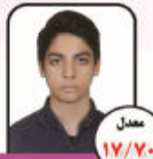
معادل ۱۷/۷۰ سجاد برجسون دبیرستان دکتر اکبریته