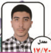
معادل ۱۷/۷۰ علسی عیسیزاده دبیرستان شهید مطهری